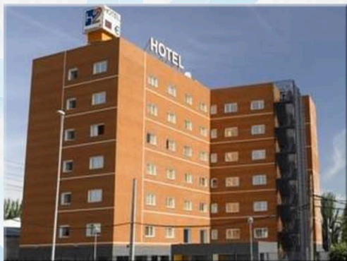
H2 FUENLABRADA FUENLABRADA Madrid-fuenlabrada ★★

DESDE 120 € POR PERSONA EN HABITACIÓN TRIPLE O CUÁDRUPLE