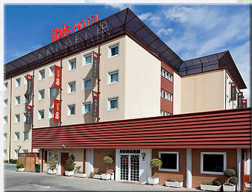
HOTEL IBIS MADRID FUENLABRADA ★ ★

Habitaciones confortables, equipadas con A/C, calefacción, TV LCD 28" y WiFi gratuito. buffet con zumo de naranja natural. Disponemos de bar con comidas 24h y parking ¡Todo lo que necesitas!